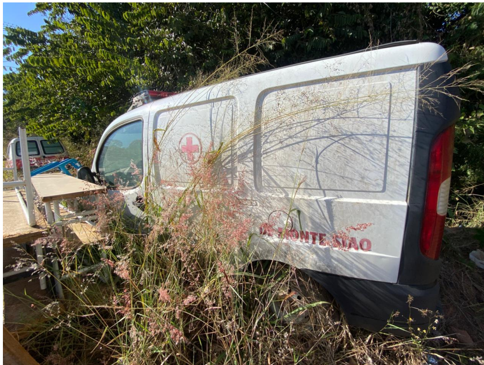
LOTE 16 – Fiat Doblô Attractive PXI0284