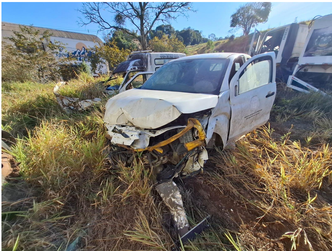
LOTE 24 – Fiat Fiorino MMM0202