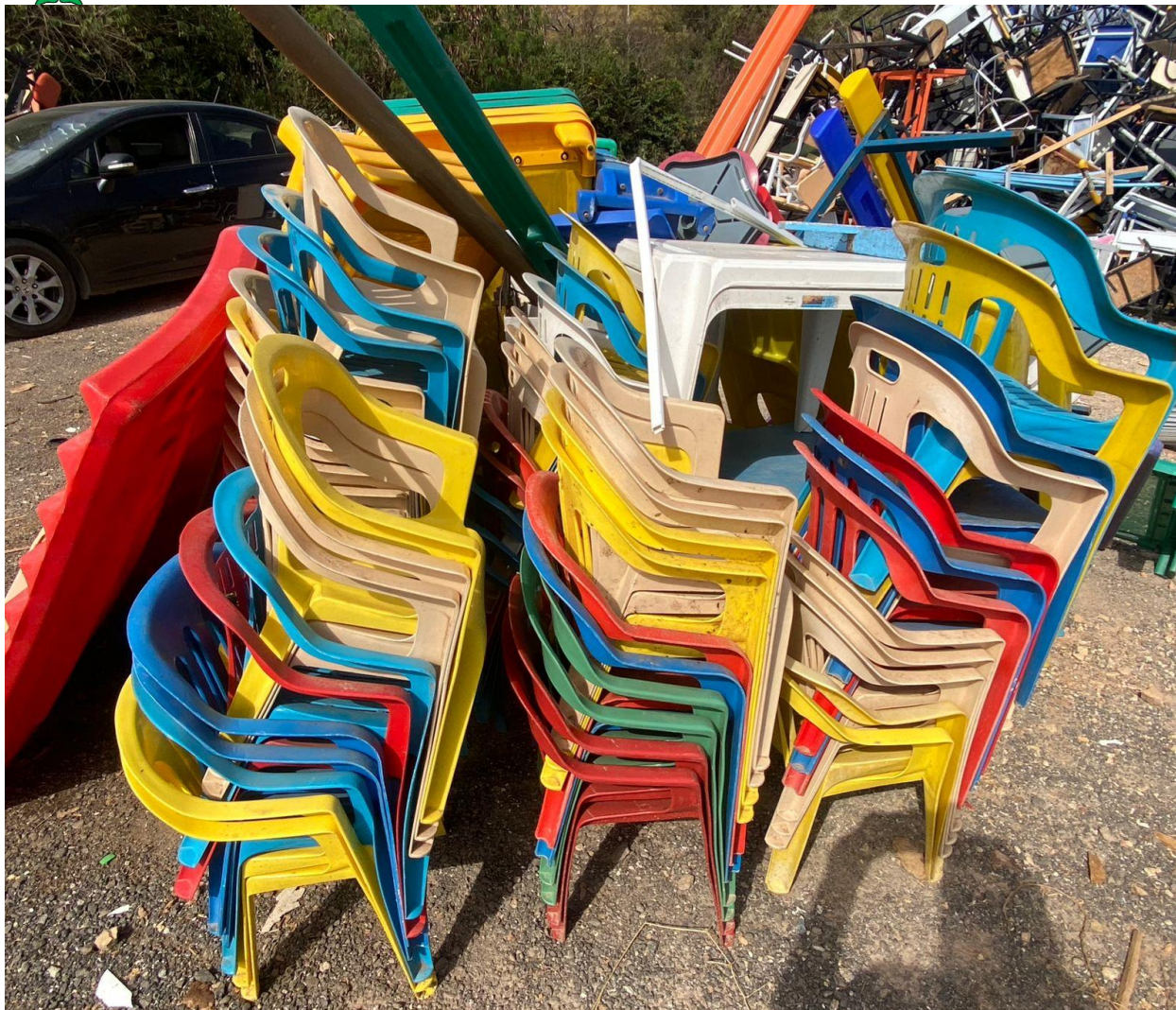
LOTE 09 – SUCATAS

Rua Maurício Zucato, 111 – Centro, Monte Siao/MG. CEP 37580-000 Telefone (35) 3465-4600 – e-mail: administracao@montesiao.mg.gov.br