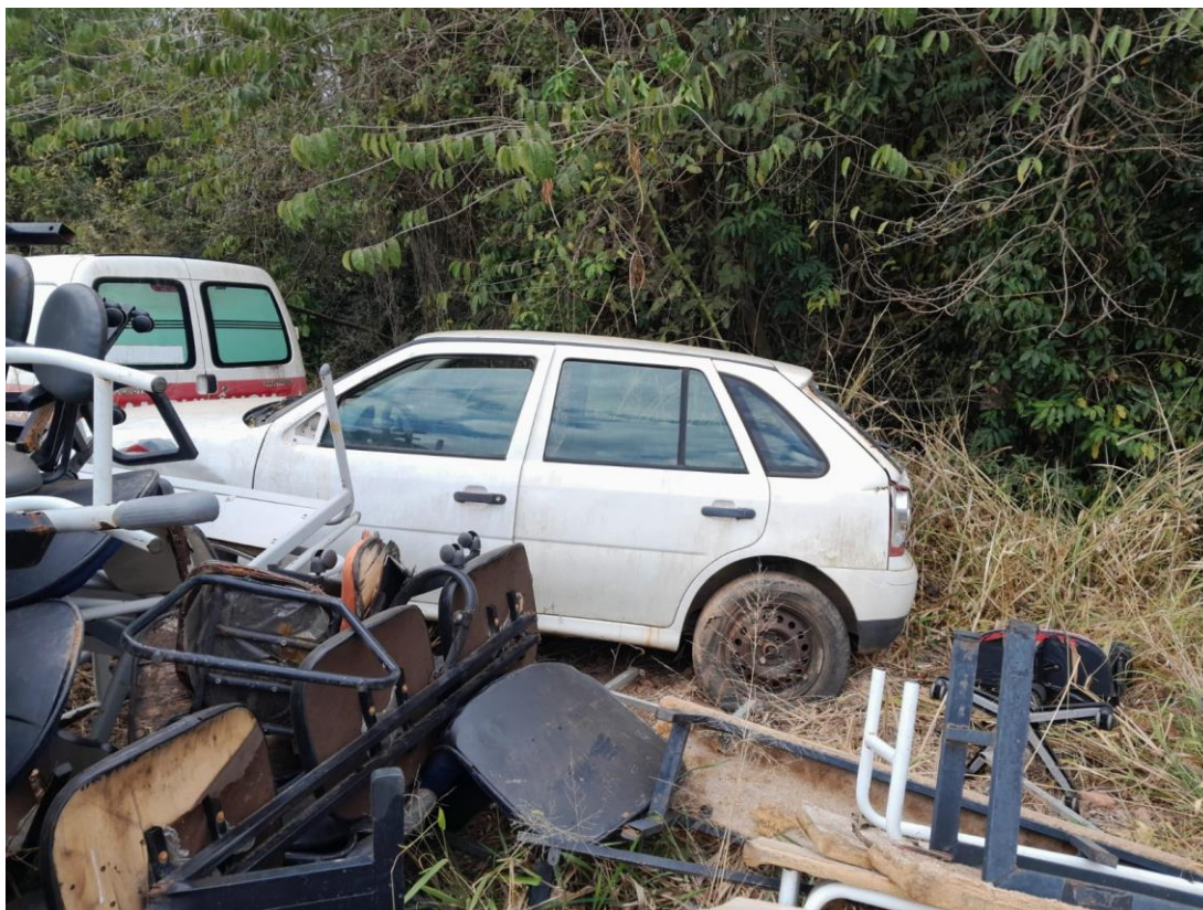
LOTE 32 – Fiat Doblô HNH0677