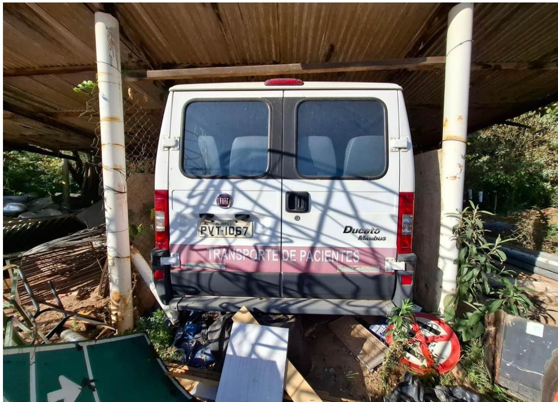
LOTE 30 – Micro Ônibus HMH4791